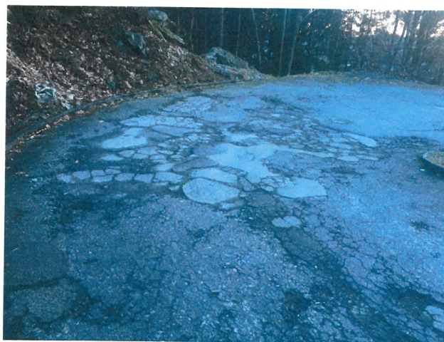
Stato di degrado dell'attuale pavimentazione

È importante ribadire l'importante funzione protettiva del bosco e delle piantagioni create con il risanamento pedemontano, così come le aree agricole e agricolo-forestale presenti a Dunzio e allacciate dalla strada.