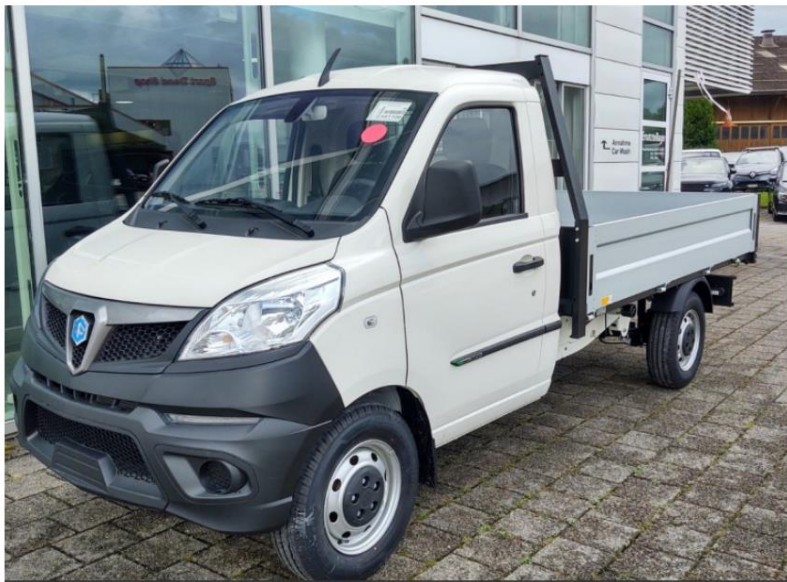
Foto: Piaggio Porter

Al momento non è noto il valore di ripresa del vecchio Piaggio.