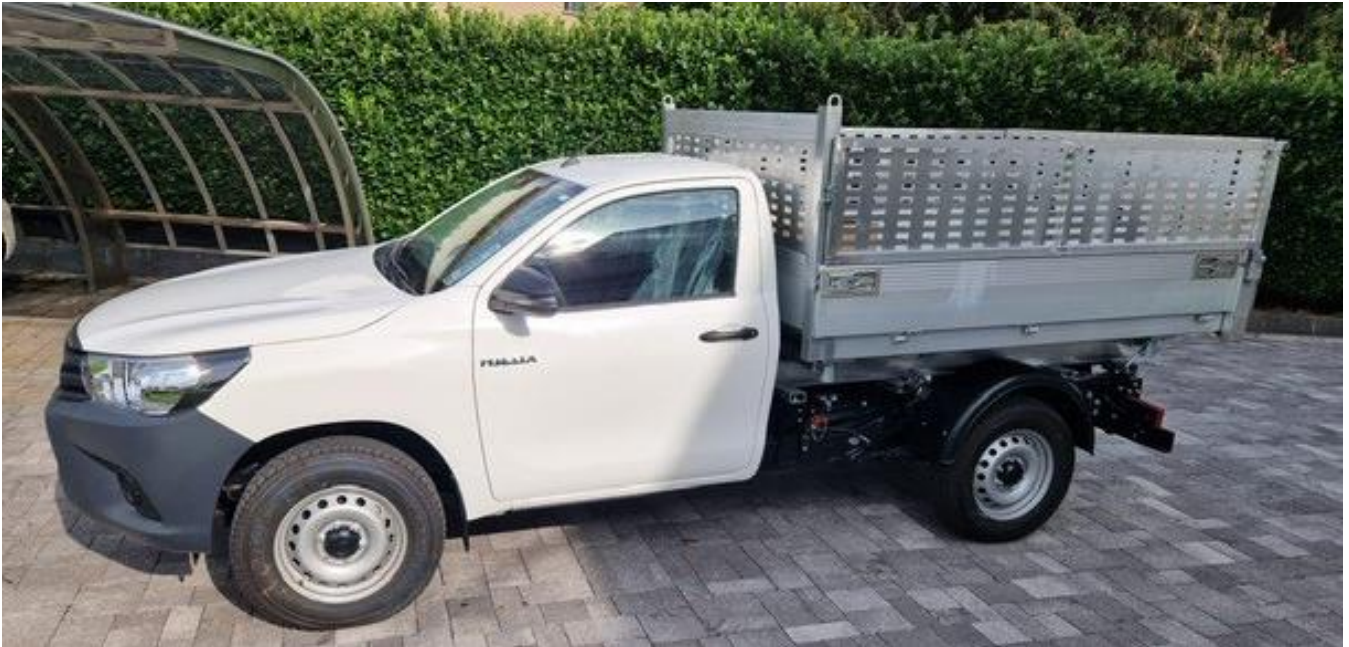
Foto: veicolo tipo pick up Toyota Hilux

Vista la spesa importante, considerata la vetustà del veicolo e la difficoltà di reperire pezzi di ricambio, si propone l'acquisto di un nuovo veicolo di diverso tipo ma maggiormente sfruttabile in tutte le stagioni dell'anno.