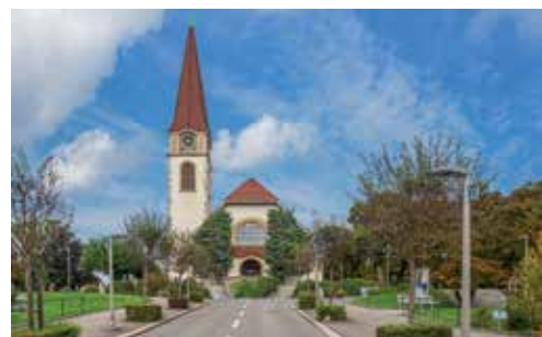
La chiesa riformata di Wallisellen

Sabato 28 settembre il Comune di Maggia ha partecipato al tradizionale mercatino "Riedenermärt" di Wallisellen, proponendo ai visitatori prodotti nostrani. La giornata è stata una buona occasione per rinfrancare gli ottimi rapporti con le autorità del Comune zurighese, che si dimostrano sempre molto sensibili alle nostre necessità, stanziando regolarmente contributi finanziari a favore del nostro Comune.