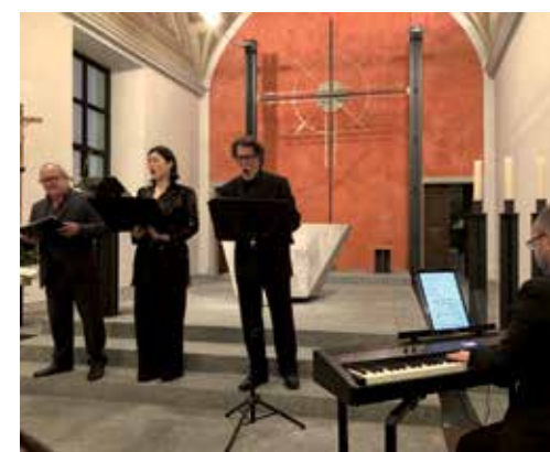
sopra Un momento del concerto di musica lirico-operistica BEMA