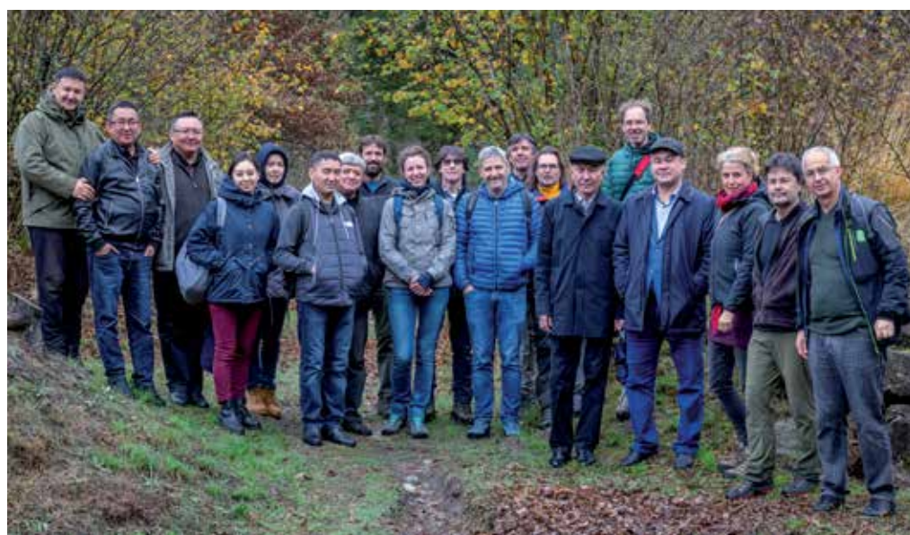
La delegazione Kazaka e la delegazione Kirghisa in visita alla golena di Lodano