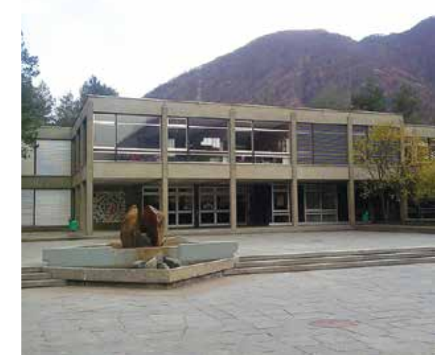
a sinistra: La sede della Scuola Media di Cevio