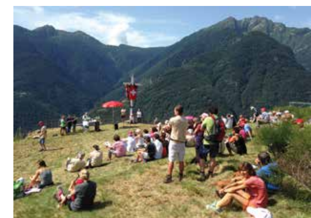
sopra: la messa ad Arnau sotto: i partecipanti della gara di Cortone