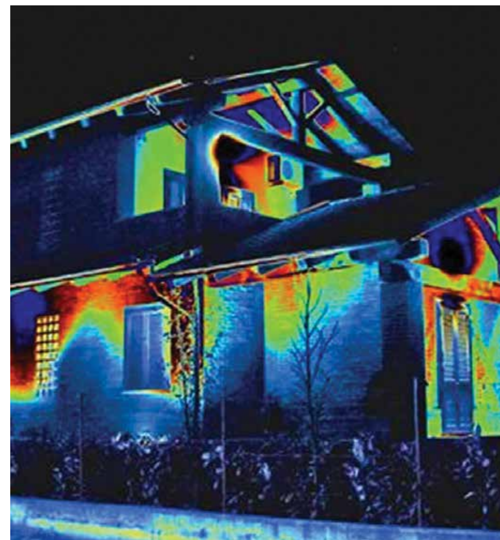
Analisi termografica di un edificio