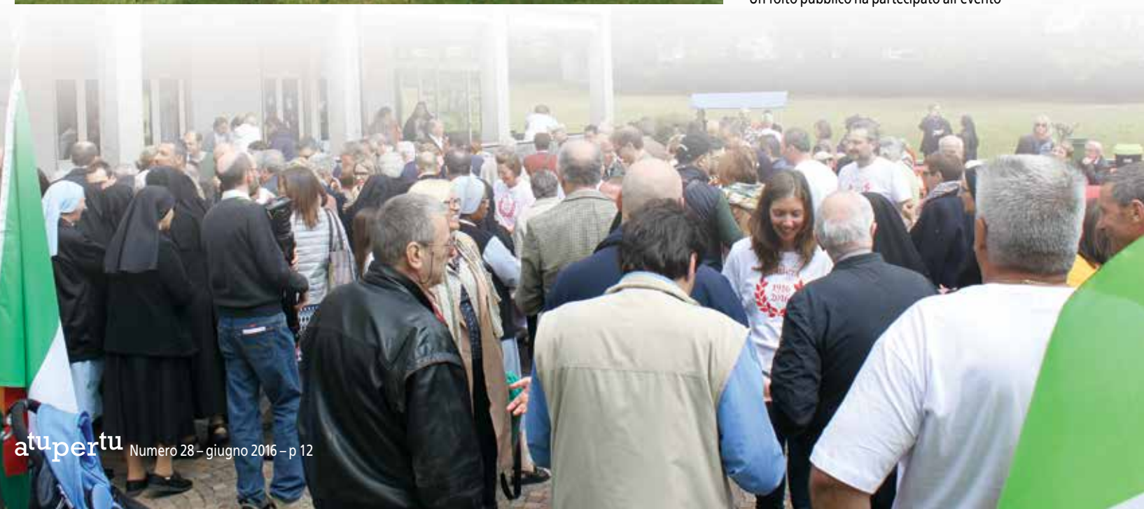
Un folto pubblico ha partecipato all'evento