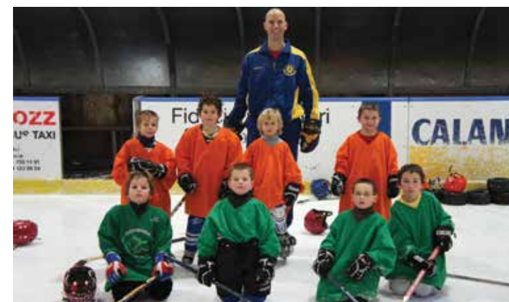
Scuola Hockey 2011-2012.