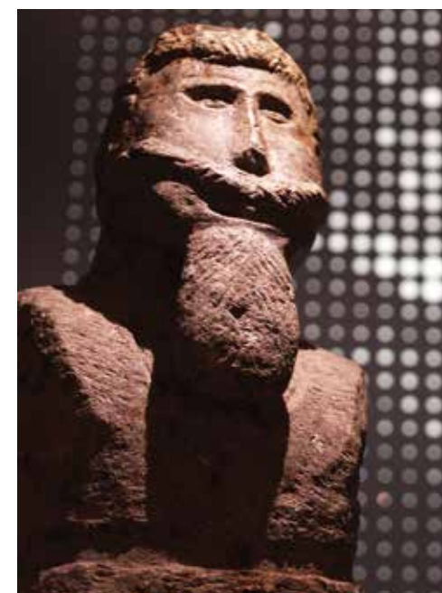
sopra: Autoritratto-scultura di Francesco Giumini.

a sinistra: La sede principale del museo. Un particolare della mostra del 50° che sarà riproposta nel corso del nuovo anno, a partire dalla prossima primavera. Nel frattempo, ci si può aggiornare leggendo il libro commemorativo fresco di stampa.