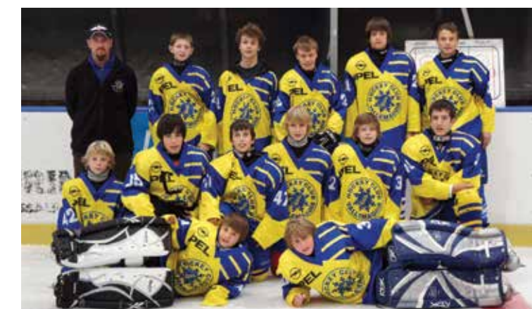
Mini A 2011-2012.