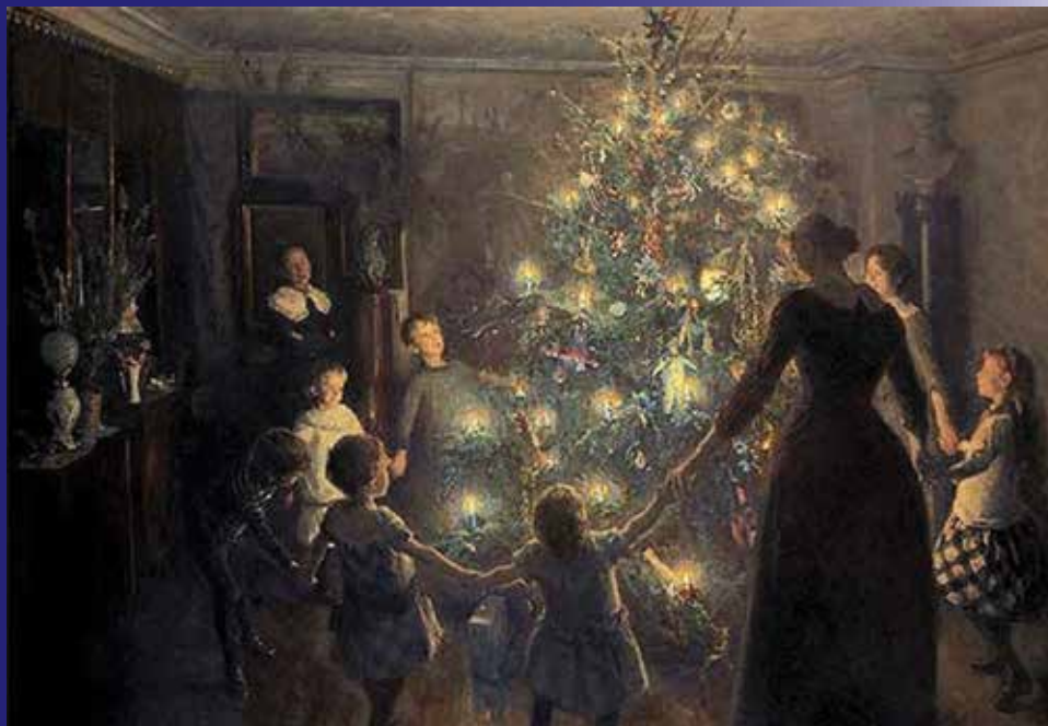
Viggo Johansen (1851-1935), Merry Christmas (1891)

Il Municipio, anche a nome dei membri del Legislativo, dei dipendenti comunali e della redazione di "A tu per tu", augura a tutti Buon Natale e Felice Anno Nuovo!