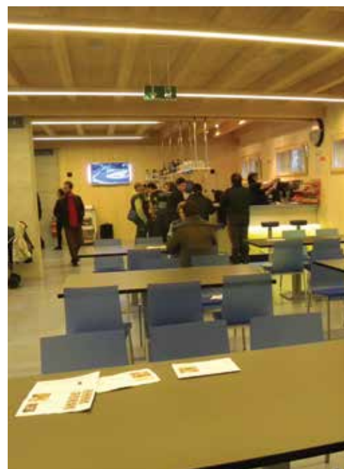
Il nuovo ristorante buvette.

1965 costituzione della società; 1966 costruzione della pista; 1967 costituzione della prima squadra hockey 3a lega; 1971 costruzione spogliatoi e pensilina; 1979 prima buvette; 1981 1° torneo hockey amatori; 1992 costituzione settore giovanile HCVM; 1993 primo ghiaccio artificiale; 1999 avvio pattinaggio artistico; 2002 installazione rete ombreggiante; 2012 copertura della pista e costruzione dei servizi annessi e della buvette-ristorante.