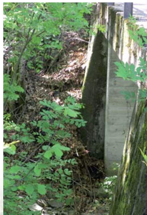
Discarica abusiva di scarti vegetali nel riale tra Lodano e Moghegno

Orari: mercoledì pomeriggio dalle 14.00 alle 17.00 sabato pomeriggio dalle 13.30 alle 17.30 Rammentiamo inoltre che è proibito depositare gli scarti vegetali sul territorio. Questi atti di inciviltà non contribuiscono certo ad abbellire il paesaggio e sono una pessima carta da visita per il Comune.