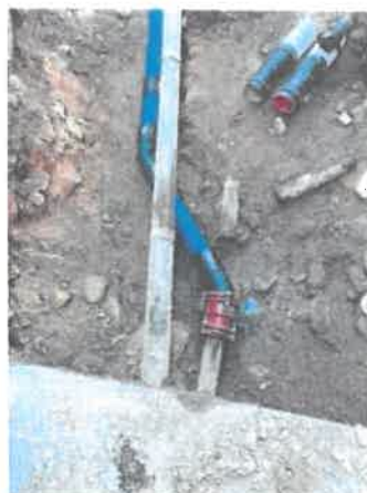
Foto ripristino tubo AP