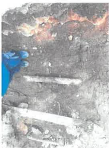
Foto situazione tubo esistente

A causa dei lavori di scavo eseguiti dalla Società Elettrica Sopracenerina nello scorso mese di dicembre per un nuovo allacciamento al mappale n°1350 RFD posto all'inizio della Caraa di Masc'lda all'intersezione con al Stradon da Magia, si è constatato lo stato precario della condotta dell'acquedotto comunale con visibili micro-perdite puntuali nella zona interessata. La SES visto le varie richieste di nuovi allacciamenti per risanamenti di edifici ora è intenzionata a proseguire con i suoi interventi così da permettere prossimamente l'eliminazione della linea aere in tutto il nucleo interessato.