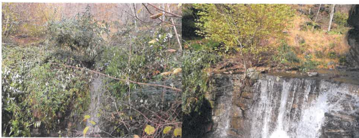
Briglia superiore "inghiottita" dalla Buddleja