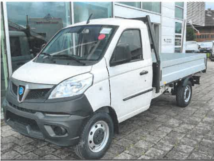
Foto: Modello di Piaggio Porter colore bianco

Al momento non è noto il valore di ripresa del vecchio Piaggio.